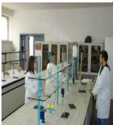
LABORATORIO DI CHIMICA