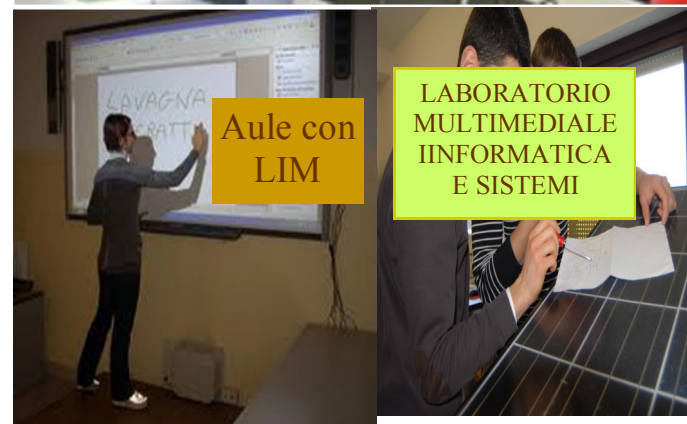
Aule con LIM